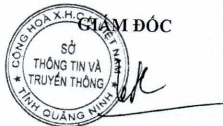
Lê Ngọc Hân